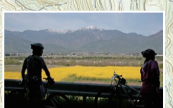
東山麓の段丘の上から高瀬川を挟んで北アルプスの餓鬼岳と向かい合う地形。見晴らし良くサイクリングが楽しい道。