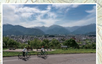
余裕があれば大町公園にも寄ってみませんか? 市街地一望の展望デッキがあり、芝生の広場から山の景色が楽しめます。