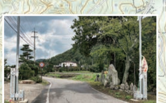
塩の道なので石仏や道祖神を多く見かけます。小さな祠や神社も点在していて、旧街道の趣き。歴史が感じられます。