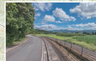
国営公園へは、美しい林を抜け、田んぼを見下ろしながら丘陵地を走り抜けます。安曇野らしい景色が楽しめる区間です。