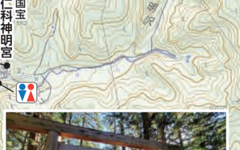
深い杉木立に囲まれ、凛とした静寂の中に建つ仁科神明宮。日本最古の神明道で境内に気が満ちるパワースポットです。

お問合せ 一般社団法人 大町市観光協会 長野県大町市大町 3200 (信濃大町駅内) TEL: 0261-22-0190