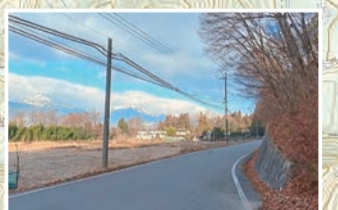
連華岳・爺ヶ岳・鹿島槍ヶ岳に對峙する北向きの方が心踊る景色が楽しめます。上り基調なので少し体力が必要ですが。