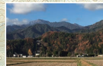
残雪の北アルプスと水田が長閑な風景を見せる常盤地区の山麓エリア