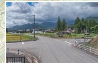
廃バスのある交差点。西進し、坂を上がると国営公園へ。等高線に沿って南下すれば坂を回避して国営公園入口交差点へ。