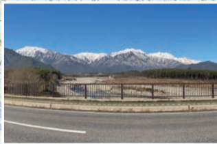
観音橋から眺める爺ヶ岳と鹿島槍ヶ岳