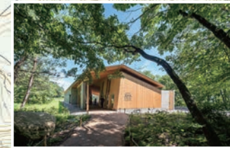
サントリーの水工場は新たな観光名所。湧水の誕生を巡る見学ツアーは予約制。事前に手配してご体験ください。