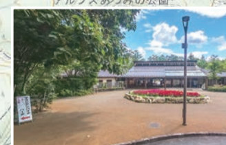
国営公園は施設が充実。トイレもきれい。道具一式レンタル可能な MTB パークも。営業日は要確認。