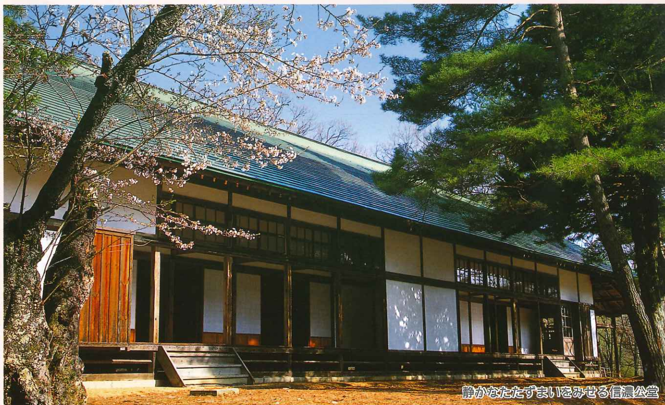
静かなたたずまいをみせる信濃公堂