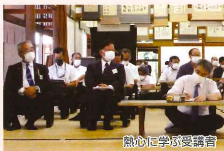
熱心に学ぶ受講者

北アルプスの麓、四季の山々の表情が湖面に映える木崎湖畔の丘の上に、わが国初めての夏期大学として信濃木崎夏期大学が開設されたのは、大正6年のことでした。今年も十分な感染対策を講じ、105回目の夏期大学を開講いたします。