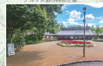
国営公園は施設が充実。トイレもきれい。道具一式レンタル可能な MTB パークも。営業日は要確認。