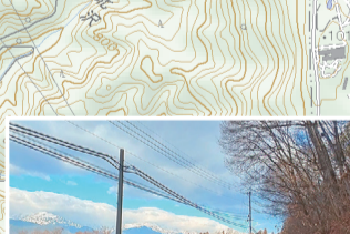
蓮華岳・爺ヶ岳・鹿島槍ヶ岳に対峙する北向きの方が心躍る景色が楽しめます。上り基調なので少し体力が必要ですが。