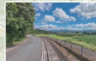
国営公園へは、美しい林を抜け、田んぼを見下ろしながら丘陵地を走り抜けれます。安曇野らしい景色が楽しめる区間です。