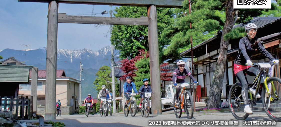
2023 長野県地域発元気づくり支援金事業 大町市観光協会