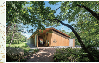
サントリーの水工場は新たな観光名所。湧水の誕生を巡る見学ツアーは予約制。事前に手配してご体験ください。