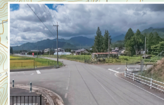
廃バスのある交差点。西進し、坂を上げると国営公園へ。等高線に沿って南下すれば坂を回避して国営公園入口交差点へ。