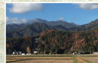
残雪の北アルプスと水田が長閑な風景を見せる常盤地区の山麓エリア