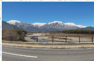
観音橋から眺める爺ヶ岳と鹿島槍ヶ岳

信濃大町駅にある大町市観光協会サイクルステーションと木崎湖南端にある信濃木崎アウトドアステーションと大町温泉郷にあるカフェ ひのきの3カ所で e-bike (電動アシスト付スポーツタイプの自転車) を借りて乗り捨てができます。 利用料金は 4 時間:1,500 円/1日:2,500 円の2種類。 デポジット:3,000 円 も必要。(乗り捨て1日:3,000 円) ヘルメットとワイヤー錠も付帯します。