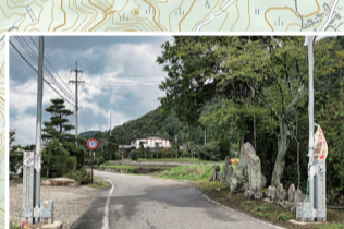
塩の道なので石仏や道祖神を多く見かけます。小さな祠や神社も点在していて、旧街道の趣き。歴史が感じられます。