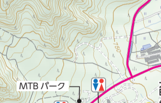
廃バスのある交差点。西進し、坂を上げると国営公園へ。等高線に沿って南下すれば坂を回避して国営公園入口交差点へ。