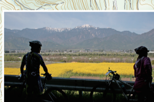
東山麓の段丘の上から高瀬川を挟んで北アルプスの餓鬼岳と向かい合う地形。見晴らし良くサイクリングが楽しい道。