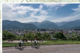
余裕があれば大町公園にも寄ってみませんか? 市街地一望の展望デッキがあり、芝生の広場から山の景色が楽しめます。